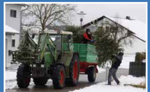
Christbaumsammelaktion in Nassenfels