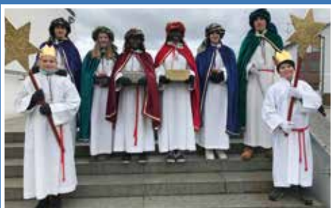
Sternsinger in Möckenlohe