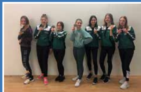
35 Jahre Eggspatzen Egweil e. V.